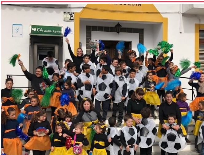
Desfile de Carnaval 01/03/2019

As escolas da freguesia prepararam os alunos para um desfile carnavalesco que animou as ruas da aldeia.