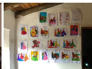
Vigência: 1/03/2019 a 31/12/2019

A Junta é parceira no projecto de cariz comunitário, promovido pela ADCMoura, e que integra três objectivos específicos: a promoção do sucesso escolar, o aumento da empregabilidade e a dinamização, participação e cidadania.