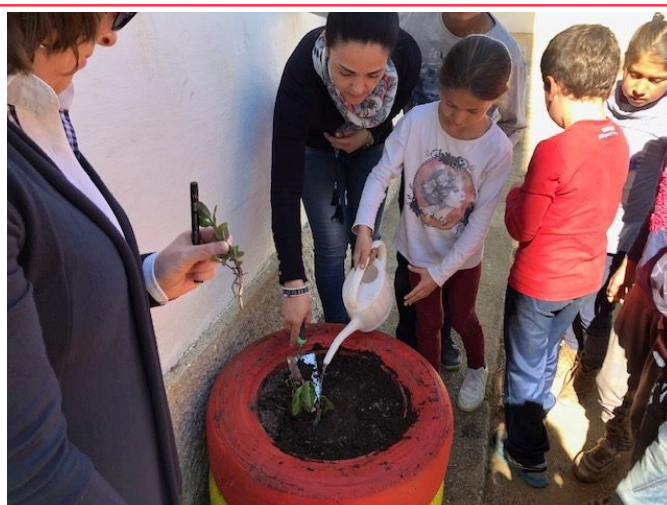
Dia Mundial da Árvore 20/03/2019

Parabéns a todos os intervenientes, a todos os alunos, assistentes operacionais, monitores, pais e professoras.