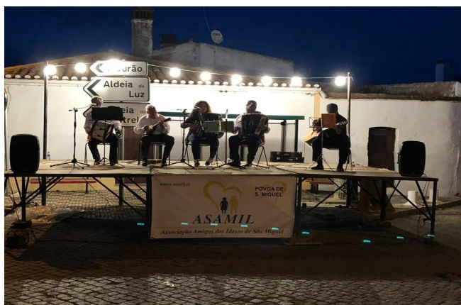
2º Encontro de Grupos Corais