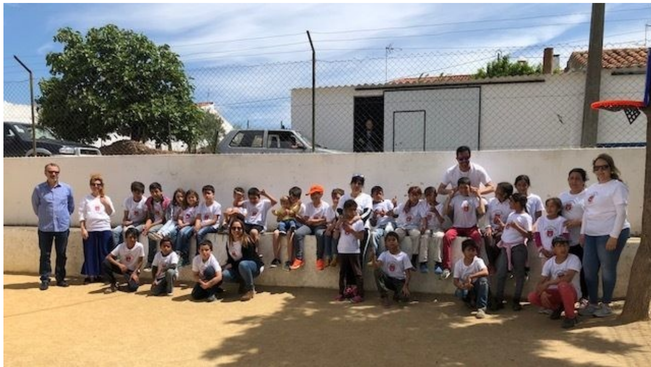
01/06/2018—Comemoração do Dia Mundial da Criança Escola EB1 e J.I.