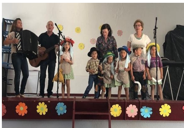
FESTA DE FINAL DE ANO LECTIVO 2017/2018