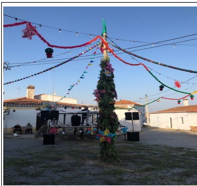
A Comissão de Festas 2017/18 instalou, com a colaboração desta Junta, o Mastro de São João no Terreiro (Largo Luís de Camões). Sábado, 23/06/2018.