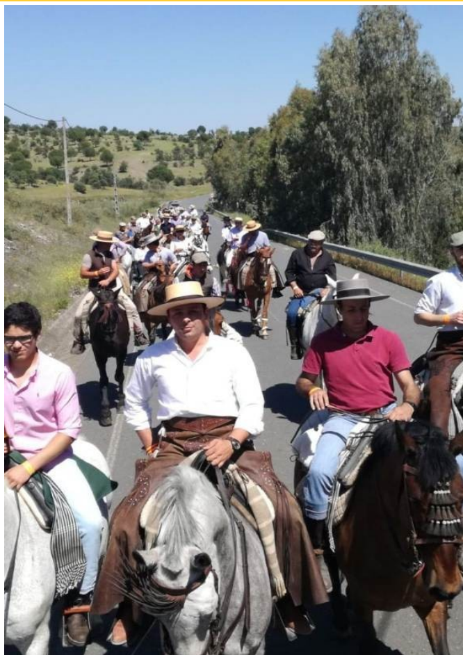
XI Passeio a Cavalo da Ass. Equestre de PSM